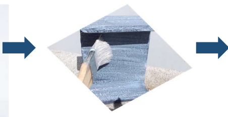
赤錆から黒錆に転換